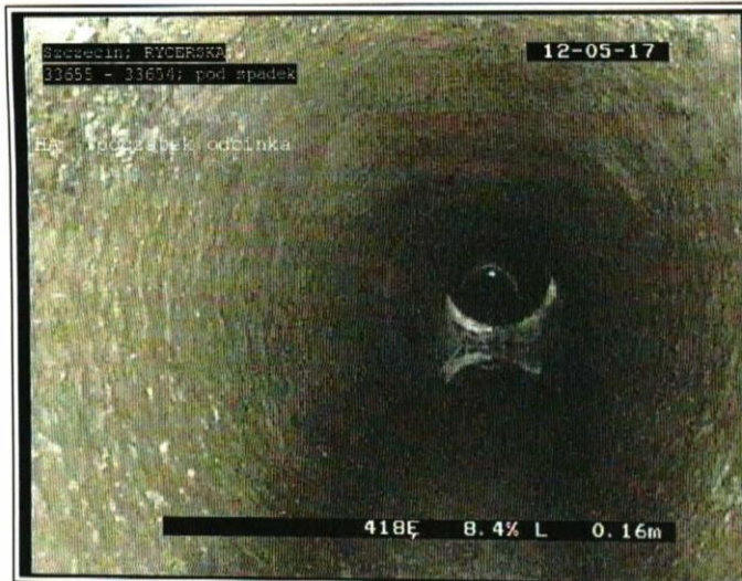
0.00 m - HA - początek odcinka