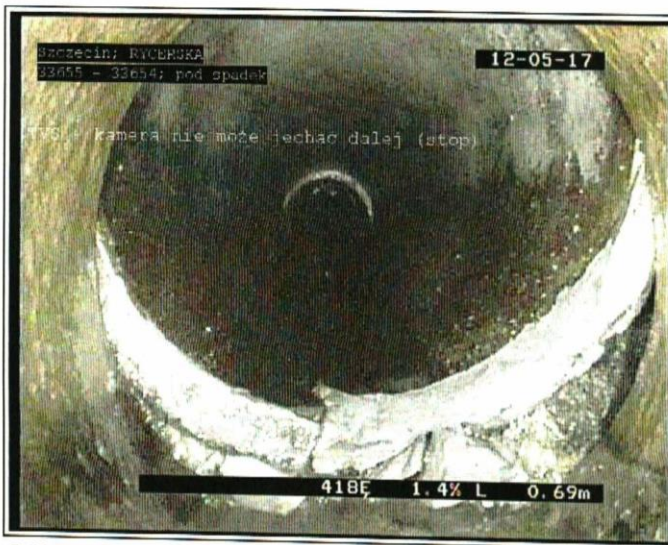
0.69 m - TVS - kamera nie może jechać dalej (stop)