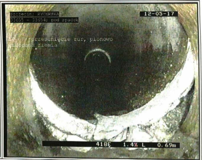
0.69 m - LV - przesunięcie rur, pionowo widoczna ziemia